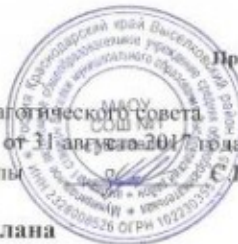
Таблица-сетка часов учебного плана MAOU SOSh № 1 ст. Выселки для 9-х классов, реализующих ФГОС ООО на 2017-2018 учебный год