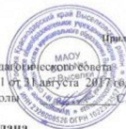
Таблица-сетка часов учебного плана MAOU СОШ № 1 ст. Выселки для 5 -х классов, реализующих ФГОС ООО на 2017-2018 учебный год